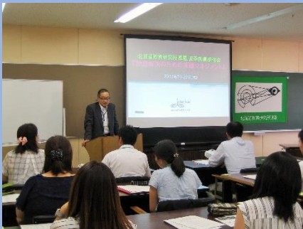
「問題解決のための実践マネジメントについて」