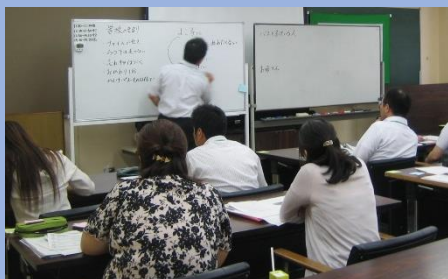
「道徳科の授業づくり（模擬授業）小」